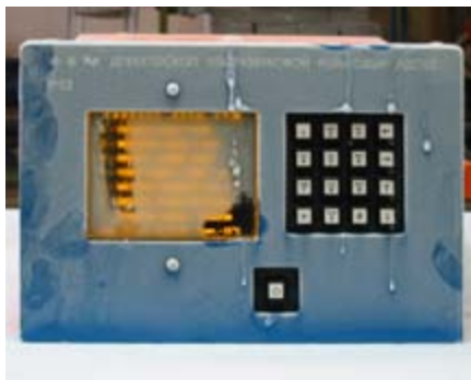
Рис. 2. Тепловой удар: с холода — в тёплое помещение

Поскольку никто не гарантировал, что найденные нами драйверы будут работать под DOS со всеми типами СФД, было проведено тестирование разных комплектов драйверов (DUSE, Motto Hairu, USBASPI и т.д.) с СФД. Большинство проверенных нами СФД ведут себя универсально и видны при работе под DOS как логические диски. Мы для себя выбрали СФД типа RB1 производства A-Data ёмкостью 256 Мбайт. Этот диск выполнен в ударопрочном водостойком корпусе из силиконовой резины, а испытания в камере холода подтвердили, что не только его электроника устойчиво работает при низких температурах, но и корпус не становится хрупким на морозе, поэтому даже при падении «свежемороженого» СФД с высоты порядка метра на бетонный пол он