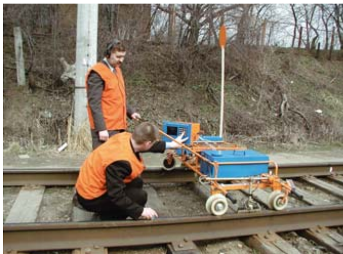
Съёмный рельсовый дефектоскоп АДС-02 в процессе испытаний (контроль сечения рельса ручным искателем)

Первая проблема была вызвана недобросовестностью части операторов. Если раньше оператор мог просто доложить, что ничего не обнаружил, надеясь, что аварии из-за изломов рельсов происходят не очень часто, то теперь стало возможным фиксировать его действия, а при анализе аварий, связанных с изломами рельсов, потребовать просмотра записей из архива.