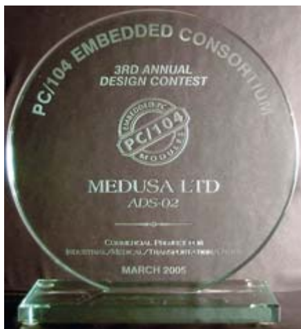
Рис. 3. Приз конкурса

тый раз консорциумом PC/104 Embedded Consortium, объединяющим производителей таких систем, мы узнали случайно, зайдя на сайт фирмы Lippert, входящей в данный консорциум. Заполнили анкету, представили запрошенные материалы и фотографии. А затем нас пригласили в Сан-Франциско, где во время выставки-конференции ESC — Embedded Systems Conference на заседании консорциума должны были быть объявлены итоги конкурса. Так мы узнали, что представленная нами работа (а это, конечно же, был дефектоскоп АДС-02) победила в номинации «Коммерческий продукт для промышленных/медицинских/транспортных и иных применений» (рис. 3).